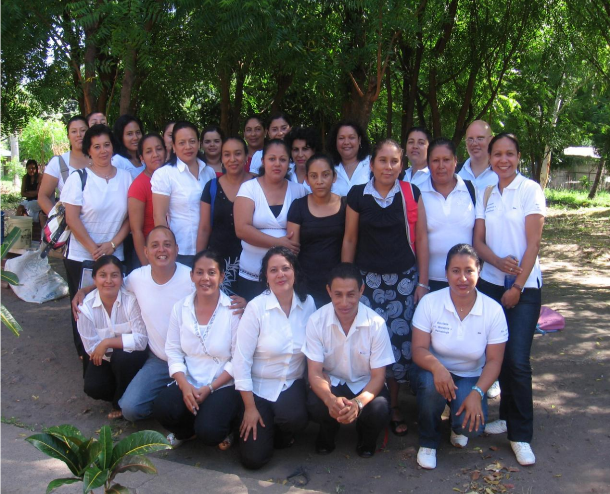
Barnmorskestudenter i Nicaragua vid barnmorskeutbildningen i Esteli